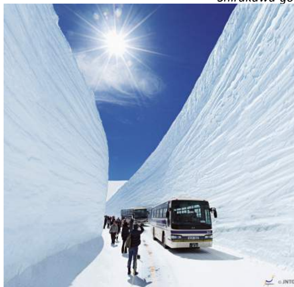
Tateyama Japan Alpes

Chegada e traslado ao Kuroyon Royal Hotel. Jantar incluso. Sugerimos apreciar o Ofuro termal do hotel