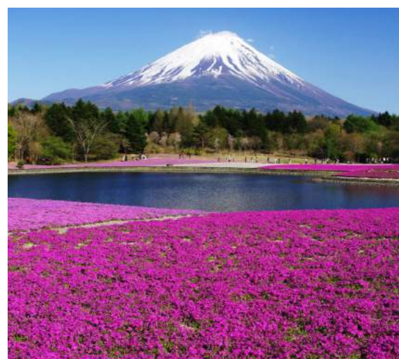
Parque de flores do Mt. Fuji

Café da manhã. Partida para visitar um cultivo de wasabi, o jardim exterior do castelo de Matsumoto., prosseguindo para Takato Castle e suas cerejeiras e posteriormente para Yamanashi. Acomodação no Shimobe Hotel, em aptos típico com tatami. Jantar incluso. Sugerimos apreciar o Ofuro termal do hotel.