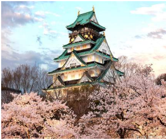
Castelo de Osaka