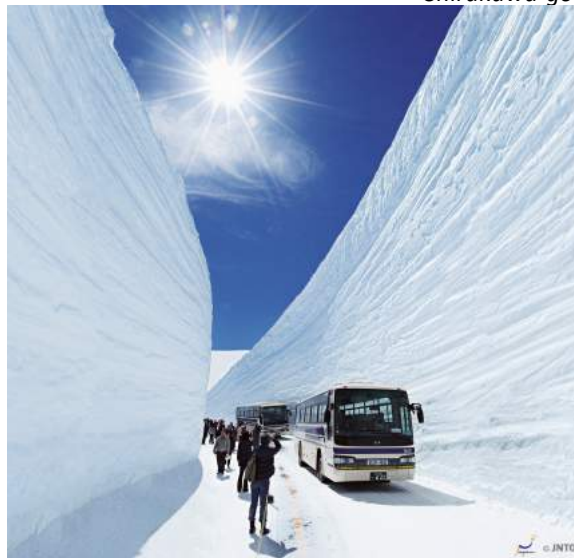
Tateyama Japan Alpes

Café da manhã. Traslado a estação de Tateyama. Chegada e início da travessia dos Alpes do Japão, com as suas fantásticas e inesquecíveis paisagens., rodovia da neve., tomando funicular bondinho, ropeway, onibus, etc . Vide mapa abaixo.