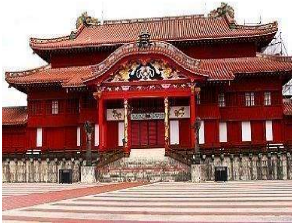
Castelo de Shuri