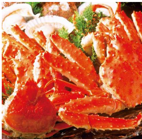
Caranguejo gigante - Kani