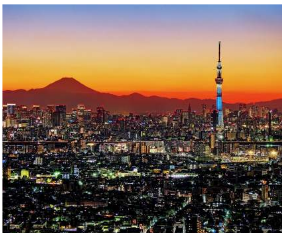
Monte Fuji e Tokyo Skytree