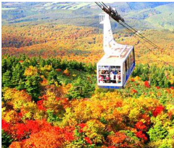
Parque Daisetsuzan Sounkyo