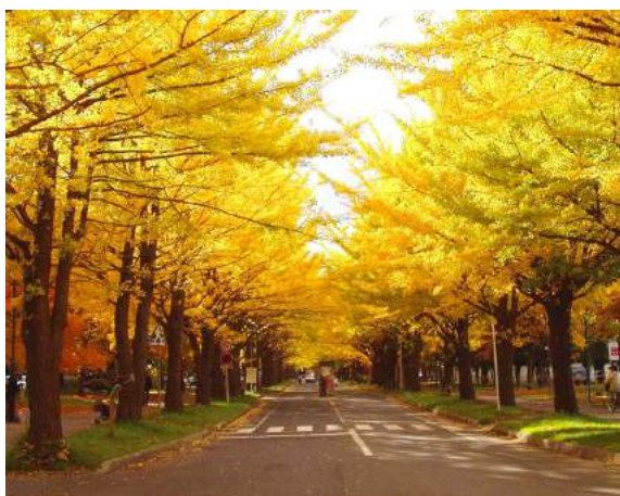
Alameda de Jinko biroba