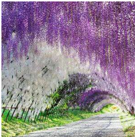
Glicínias (Fuji no hana)