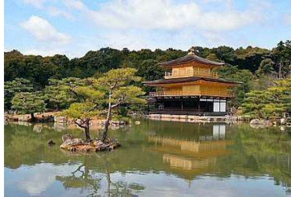
Kinkakuji - Kyoto