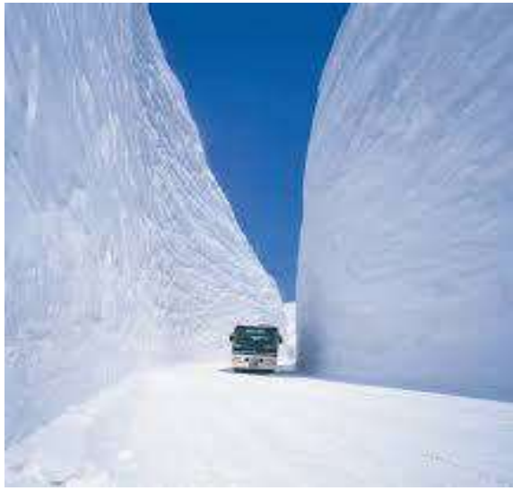
Tateyama Japan Alps