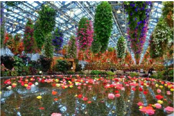
Nabana no Sato