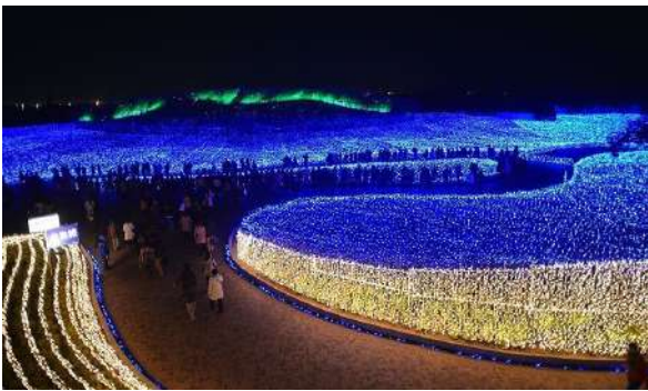
Milhões de leds em Nabana no Sato