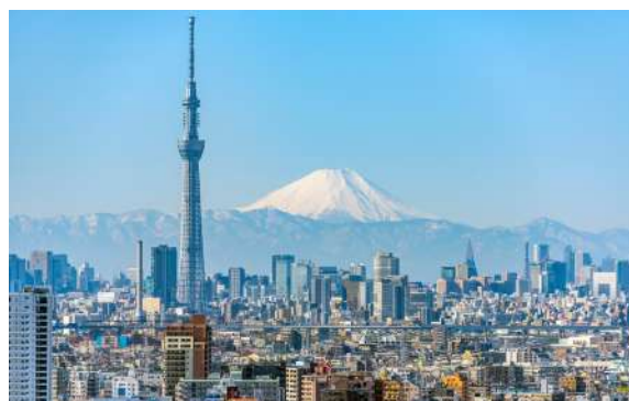
Tokyo Sky Tree e Mt. Fuji

12º Dia - 03/Maio - Dom. - TATEYAMA - Alpes do Japão - MURODO (2450m)- KUROBE(1450 m) - OGISAWA (1.430 m)- YUDANAKA