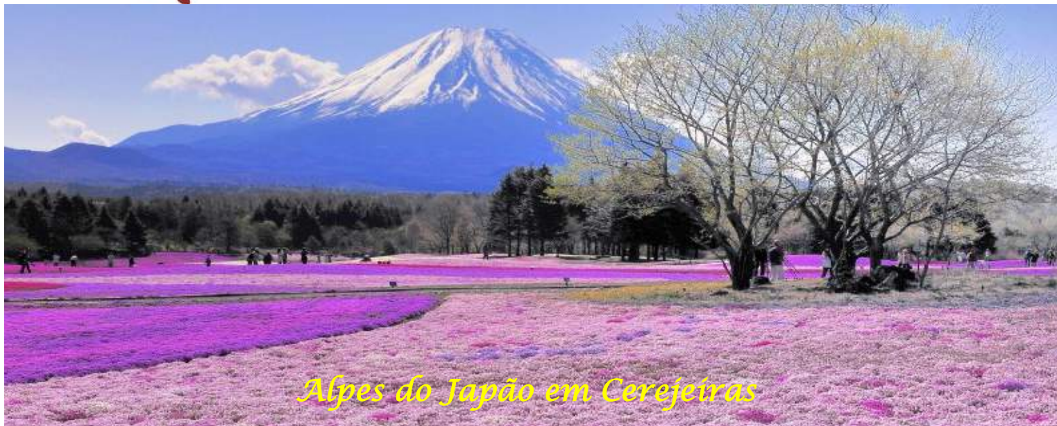
Alpes do Japão em Cerejeiras