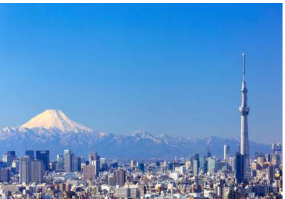
Tokyo Sky Tree e Monte Fuji

Chegada em Dubai e conexão imediata para São Paulo. Chegada em Guarulhos, terminal 3 - previsto para 16h00. Liberação após formalidades de imigração e alfândega.