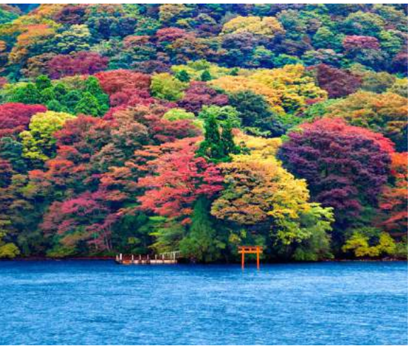
Lago Ashi - Hakone

Café da manhã. Partida para visitar um cultivo de wasabi, jardim exterior do Castelo de Matsumoto, prosseguindo para as ruínas do Castelo de Takato, com as suas belíssimas cerejeiras. Continuando a Yamanashi e acomodação no Shimobe Hotel, em aptos típicos de tatami. Jantar incluso. Recomendamos apreciar um relaxante banho no ofuro termal do hotel, experiência única para serenar a mente, lavar o corpo e a alma.