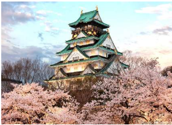
Castelo de Osaka