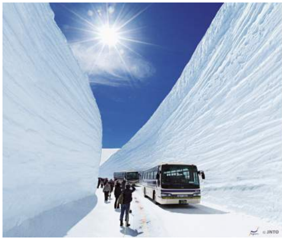
Rodovia da Neve - Alpes do Japão