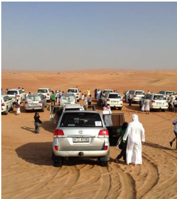
Excursão Land Cruisers

Café da manhã e visita panorâmica da cidade, começando pela , região antiga, visitando o Museu de Dubai., atravessaremos o "Dubai Creek" no tradicional taxi aquático "abra", no outro lado está o Bairro Deira, ao longo da Baniyas Road conheceremos os "souks", bazares de especiarias, o Gold Souk e continuando para Jumeirah, pela Sheik Zayed Road, área financeira que ostenta um cenário de prosperidade com os seus edifícios futurísticos, como Burj Khalifa, inaugurado em 2010 com 828m de altura, é o arranha céu mais alto do mundo. Seguimos pela orla de Jumeira Beach, passando pelo tradicional bairro Jumeirah, o Hotel Burj Al Arab mundialmente famoso pelo seu formato de vela., continuando para a famosa ilha condominio "Palm Jumeirah", passamos de frente ao Atlantis Hotel e retornamos ao hotel. 15:00hs partida para a mais popular excursão em Land Cruisers 4x4 de 6 lugares, partindo em caravana para um passeio fantástico através das dunas de areias finíssimas. Ao por do sol nos dirigimos ao Desert Safari Camp, para assistir um show típico sob as estrelas, com apresentação da dança do ventre e outras atrações folclóricas. Jantar beduíno e retorno ao hotel por volta das 20:30 horas. Aptos disponiveis até as 23 horas e traslado ao aeroporto.