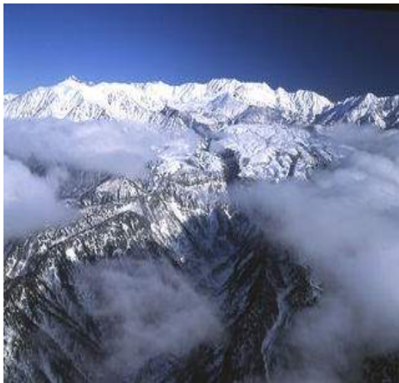
Alpes do Japão

Chegada e traslado ao Kuroyon Royal Hotel. Jantar incluso.