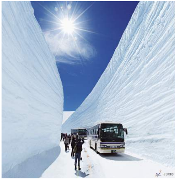
Rodovia da neve - Japan Alps