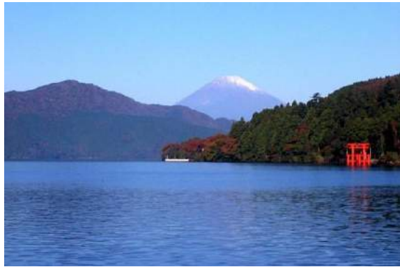
Lago Ashi - Hakone