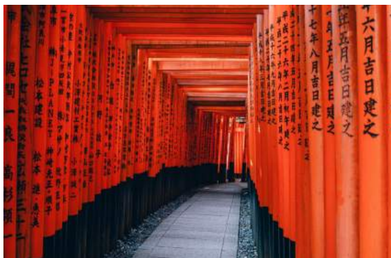
Castelo de Nijo