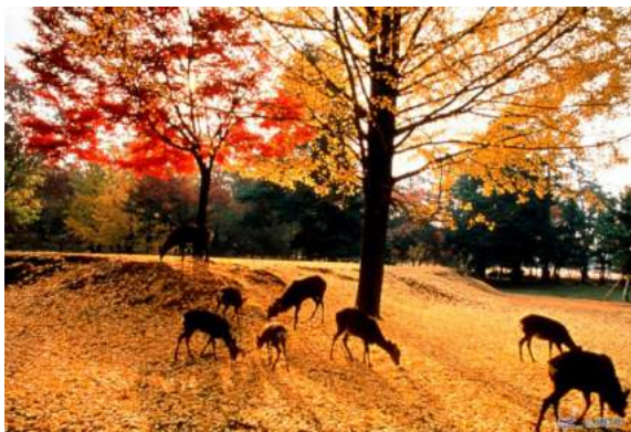
Santuário de Heian

Saídas garantidas: aos Domingos do Brasil Guias locais em Espanhol Saídas extras as 2ª e 4ª de Março a Outubro 2019