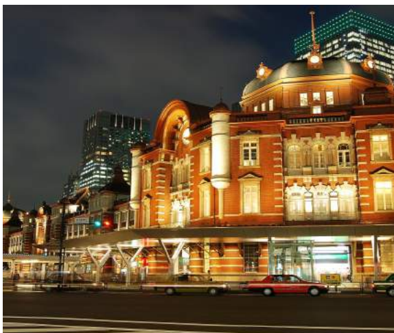
Estação de Tokyo