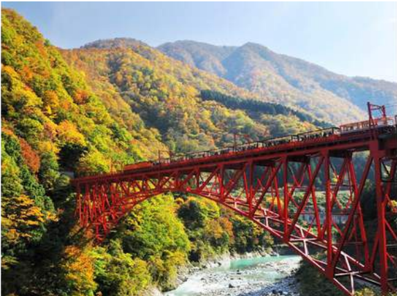
Unazuki Onsen - Kurobe Gorge