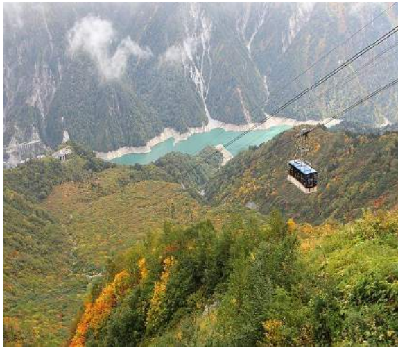
Descida para Kurobedam