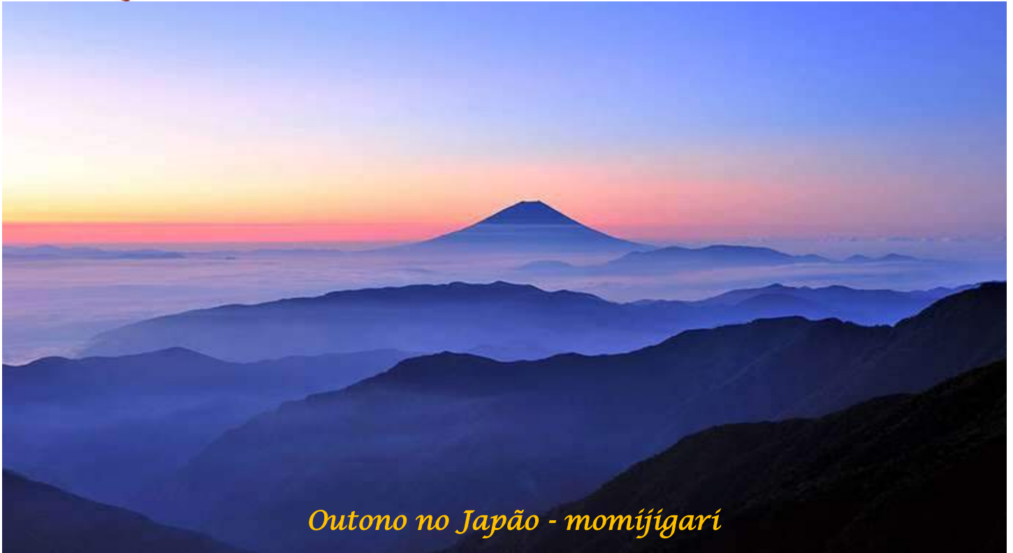
Outono no Japão - momijigari