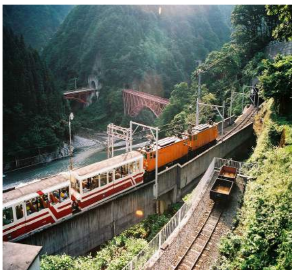
Kurobe Gorge Railway