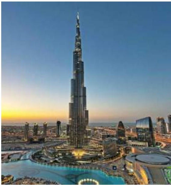
Dubai Burj Khalifa