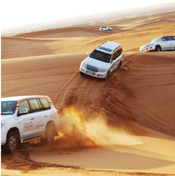
Dubai Desert Safari